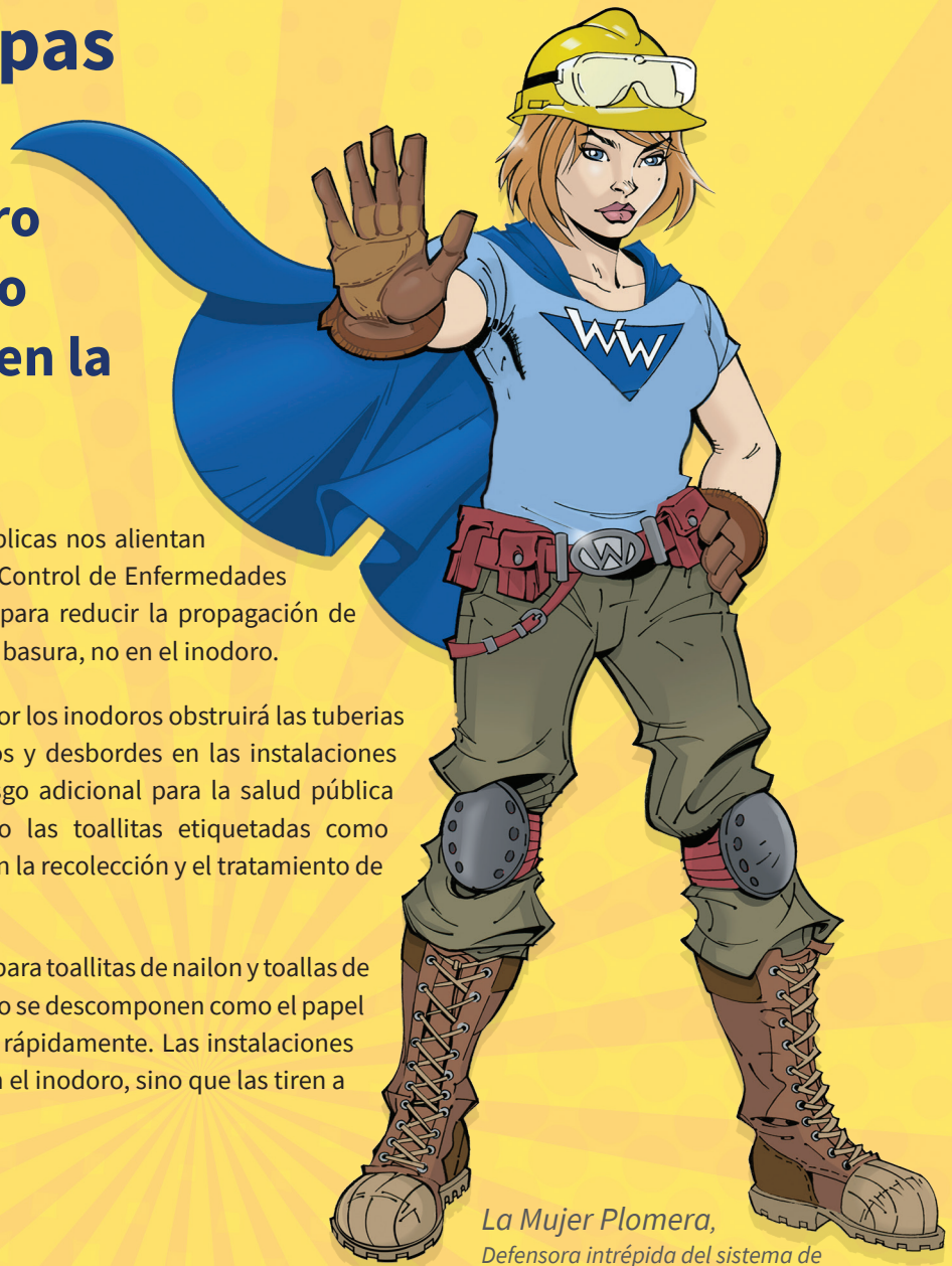
La Mujer Plomera, Defensora intrépida del sistema de drenaje alcantarillado

Por favor, no tire toallitas desinfectantes o toallas de papel por el inodoro.